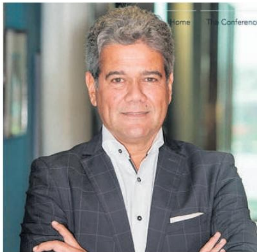
na Handelskade, pero e banco solamente por a organisa algun poco ton, Antiliaans Dagblad a comenta dialuna.

Banco de Orinoco a bati bancarota. Hues a declara cu un luna pasa, Banco Central di Corsou y St. Maarten a retira e licencia bancario di Banco de Orinoco. Segun corte, e banco a presenta documentacionnan falsifica pa aparece cu nan ta financieramente solido. Ademas nan a viola regulacionnan contra labamento di placa, e operacionnan comercial no ta na ordo y e instruccionnan di Banco Central a wordo mal sigui. E titular di e cuentanan tabata tin 1500 milyon di saldo di credito cu e banco Venezolano